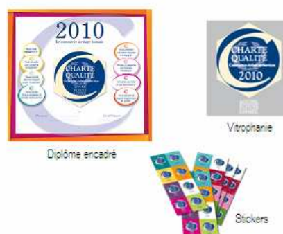
Kit magasin millésimé remis aux entreprises lauréates de la Charte Qualité.