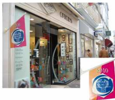
Devanture d'une entreprise engagée dans la Charte Qualité.